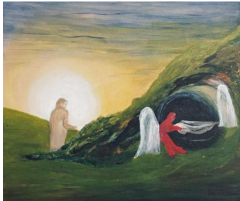
Bep van Doornum