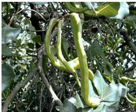
Peulen van de boom